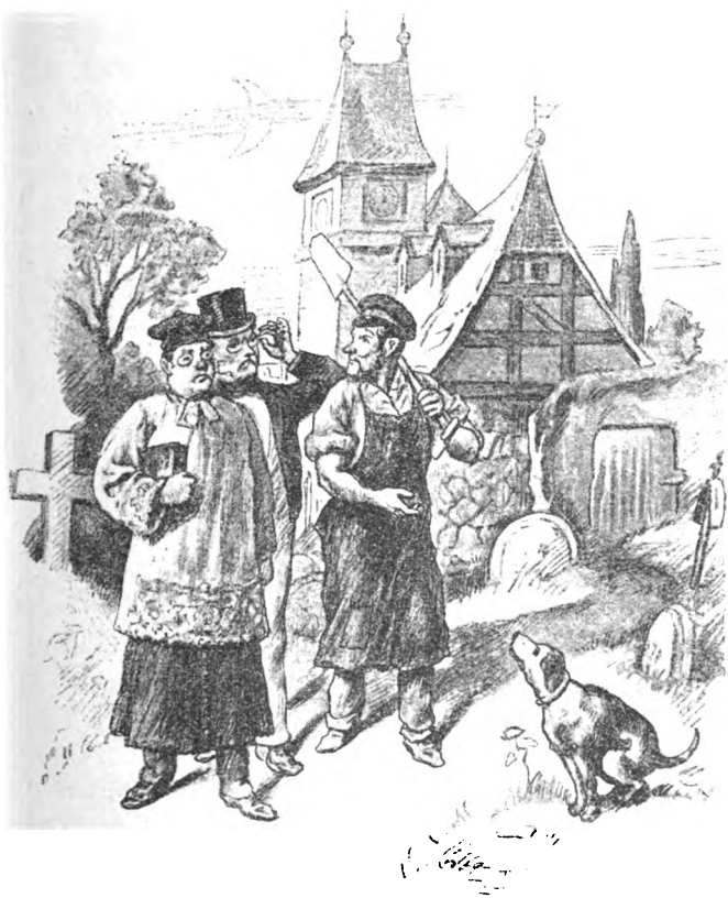
Fig. 3. De Kaplaen reip: „Söll he dao begraven liggen?“