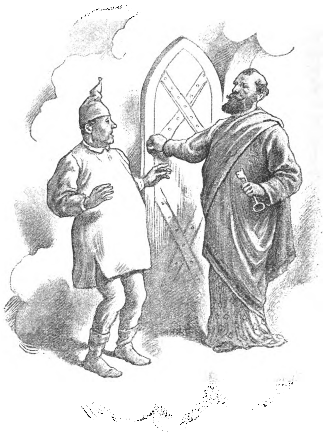
Fig. 1. „Wat de Kaplaon segg, dat gelt hier nich!“ — segg Ferrus.