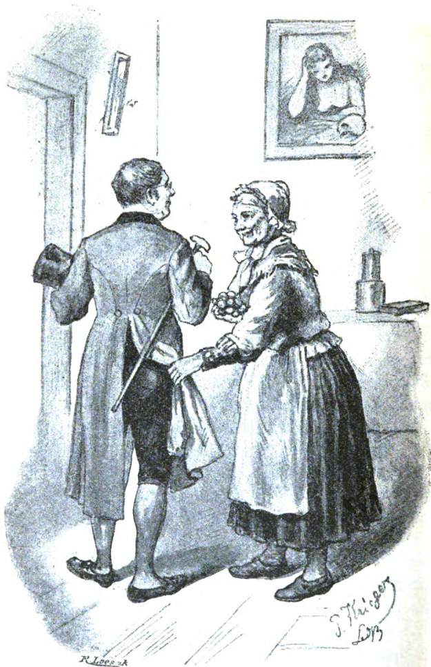
Fig. 9. Greithe stuof den Pastoor Wallnütte in de Tasse.