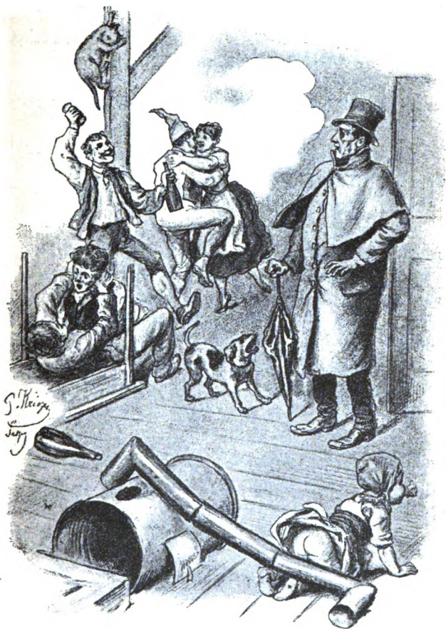
Fig. 7. Wat mook Rôwefaat fûôr Rugen, às he muorgens nao Huus quam.