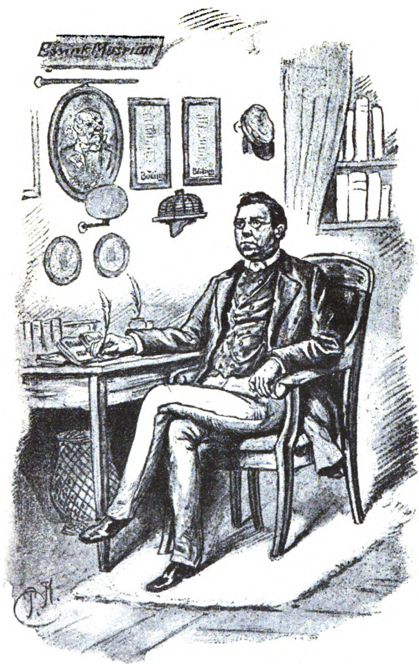
Fig. 12. Professor Iselmott schriew den 4. Band „Frans Essint up de Seelenwanderunt.“