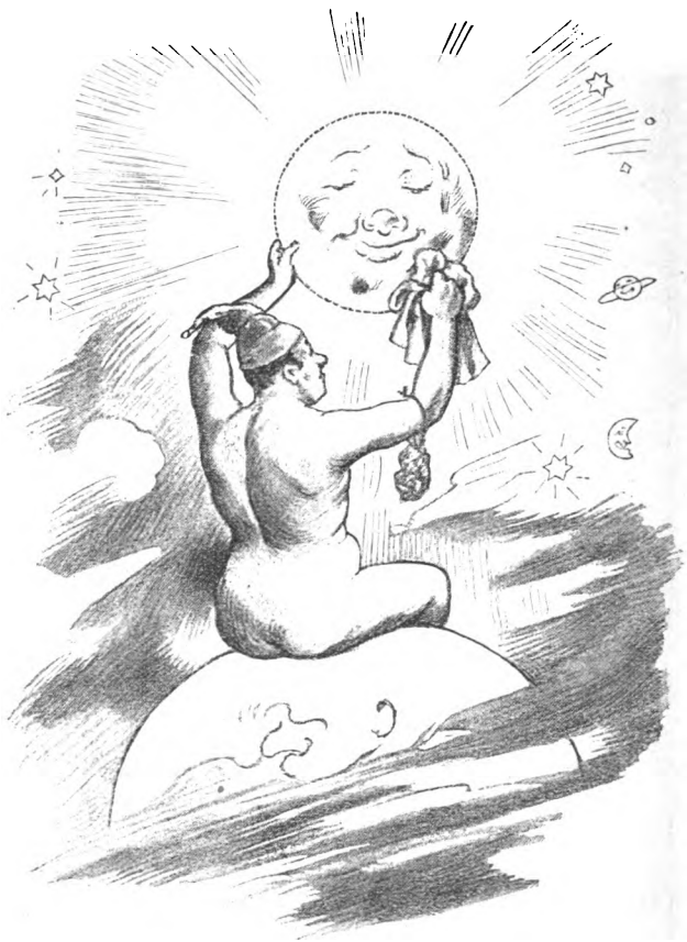
Fig. 2. Dao satt nu de arme Frans bi de gleinige Arbeit, bi't Sonnenrugen!