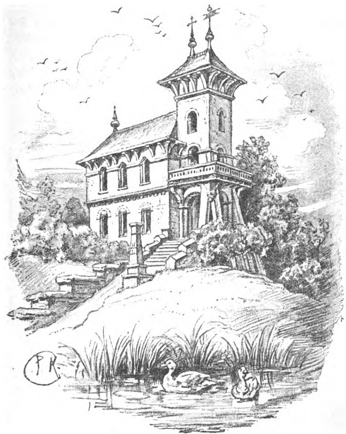
Fig. 10. Dat is de niee Ludeburg.