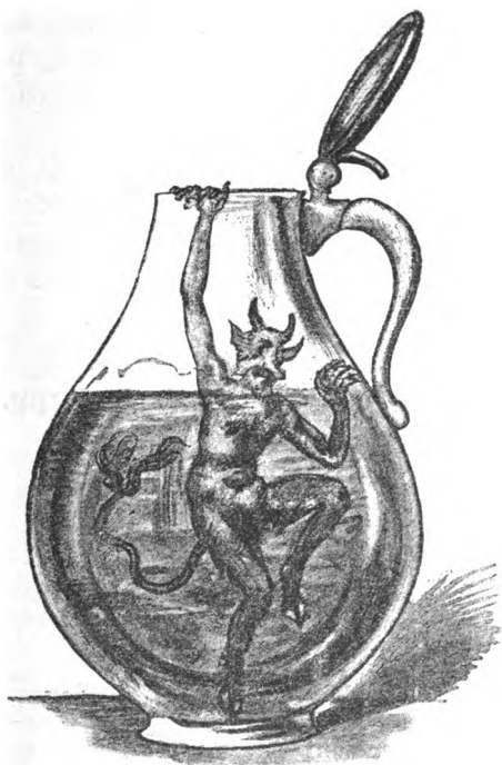
Fig. 4. De Düwel in en Bullentopp.

Drüm so lang von Blot en Druoppen Flütt düör meine Adern rauth, Gelt mien Gläuwen un mien Huoppen Mien Westfaolen! bes tom Daud.