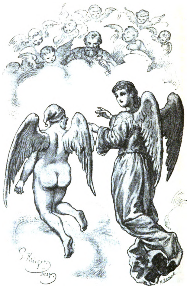
Fig. 11. Met en Wupp waoren Frans un de Engel an de Himmelsdüöre.